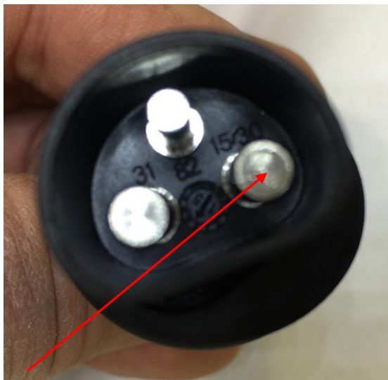
Frontansicht, Kontakt „30“ Plus (+)