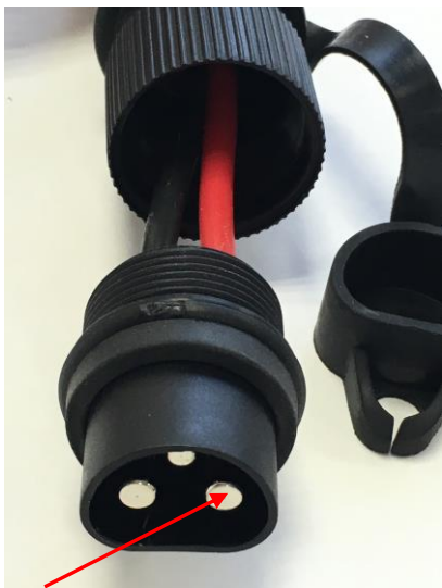
Draufsicht, rechter Kontakt Plus (+), rotes Kabel